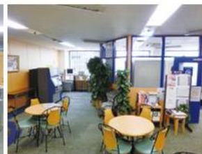
ラウンジ (約144平方メートル) ・テーブル個数:4個・椅子個数:20脚 ・50インチ液晶テレビ・DVDプレイヤー