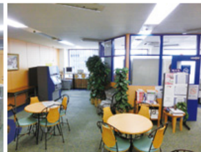
ラウンジ (約144平方メートル) ・テーブル個数: 4個 ・椅子個数: 20脚 ・50インチ液晶テレビ ・DVDプレイヤー