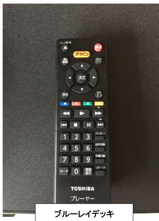
ブルーレイデッキ